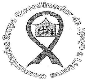
Figura 2. Logotipo Grupo Coordinador de Apoyo a Líderes Comunitarios. Tomado de la sistematización, 2005.